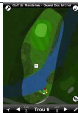
Mandelieu Grand Duc trou n°6

La DZ est située sous le pin placé à la droite du green. Elle est utilisée pour toute balle rentrant dans l'obstacle d'eau.