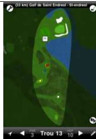
St Endréol trou n°13

La DZ est située sur la bande de terre située entre les deux bassins à gauche de la route. Elle est utilisée pour toute balle envoyée dans l'obstacle.