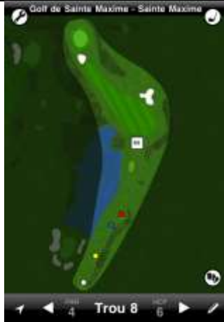
Ste Maxime trou n°8

La DZ est située juste avant le début du fairway au niveau de la fin de l'obstacle d'eau. Elle est utilisée pour toute balle finissant dans l'obstacle d'eau.