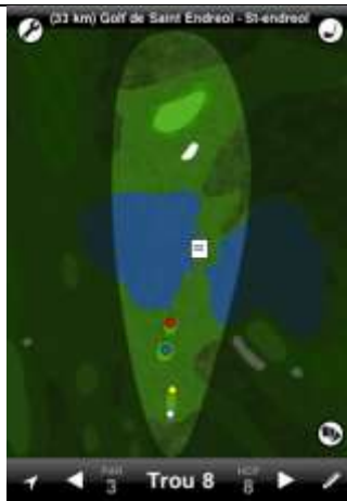
St Endréol trou n°8

La DZ est située au début de la partie plane située devant le green. Elle est utilisée pour toute balle n'arrivant pas jusqu'au green mais envoyée dans l'axe du drapeau.