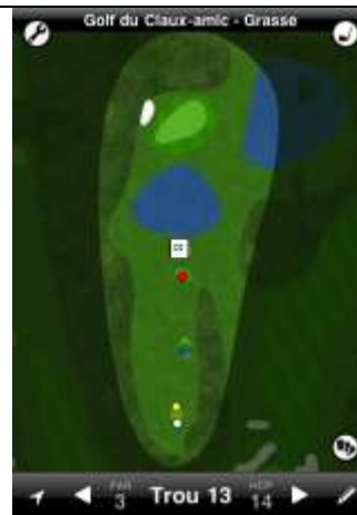
Claux-Amic trou n°4 (anciennement le n°13)

Ces DZ sont utilisées lorsque la balle termine sur la route en béton ou dans le tunnel. Le joueur utilise alors la DZ la plus proche de sa balle.