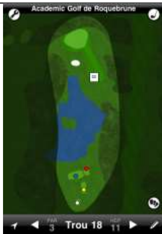
Roquebrune trou n°18

La DZ est située à droite de la route, proche de l'entrée du green, sur le côté du mur en pierre. Elle est utilisée pour toute balle rentrant dans l'obstacle d'eau placé face au mur.