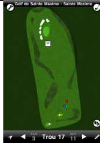
Ste Maxime trou n°17

La DZ est située juste avant le début du fairway au niveau de la fin de l'obstacle d'eau. Elle est utilisée pour toute balle finissant dans l'obstacle d'eau.