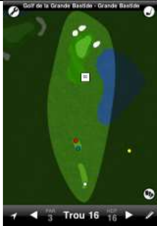
Grande Bastide trou n°16

La DZ est située devant le green sur la droite. Elle est utilisée pour toute balle finissant dans l'obstacle d'eau.