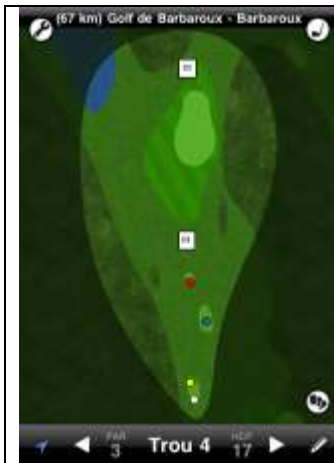
Barbaroux trou n°4

La présente section présente la position des différentes Dropping Zones des parcours joués lors des compétitions AGACECA. Pour chacune d'elle, une description précise les conditions particulières.