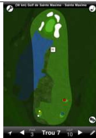
Ste Maxime trou n°7

La DZ est située sur la gauche au début du fairway placé à droite du green. Elle est utilisée pour toute balle ne franchissant pas l'obstacle.