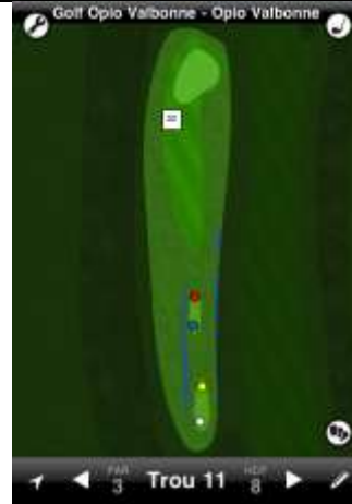
Opio Valbonne trou n°11

La DZ est située devant le green sur la droite. Elle est utilisée pour toute balle finissant dans l'obstacle d'eau.